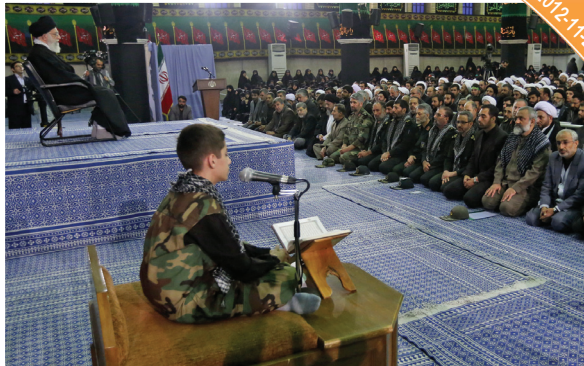
لقاء التعويين «مشروع الصالحين»