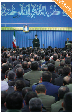
لقاء استخبارات القوات المسلحة