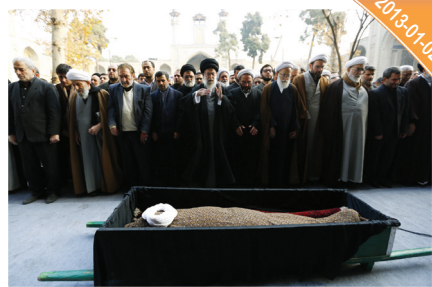
المشاركة في تشييع العلامة مجتبي الطهراني