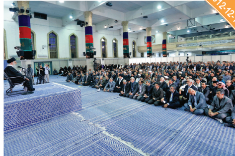
المؤتمر العالمي لأساتذة الجامعات والصحة