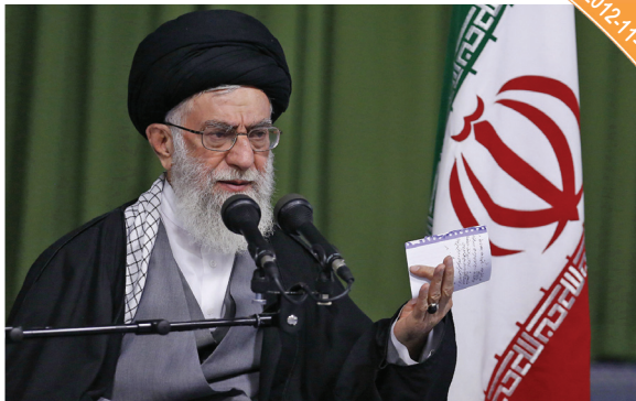
في الملتقى الرابع للأفكار الاستراتيجية