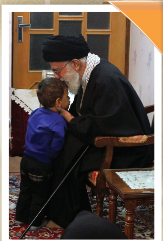
زيارة عوائل الشهداء