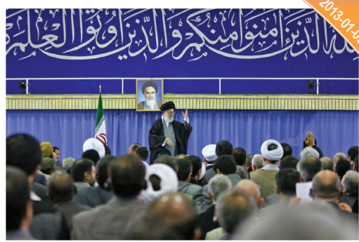
لقاء أهالي قم وذكرى 19 دي