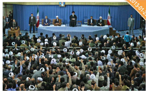
لقاء ضيوف مؤتمر الوحدة الاسلامية