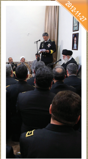
لقاء قادة القوة البحرية