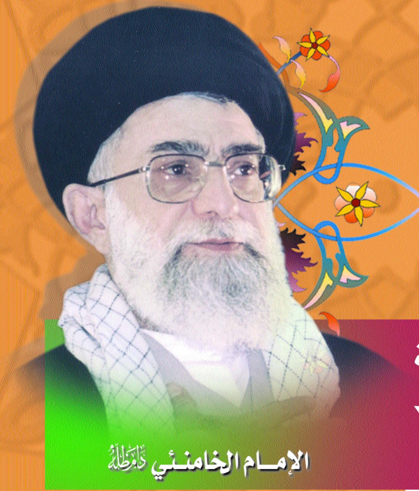
الإمام الخامنئي قدس سره